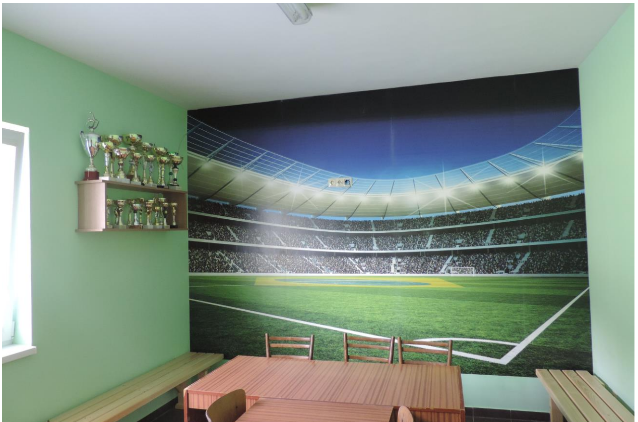
Budova pre šport